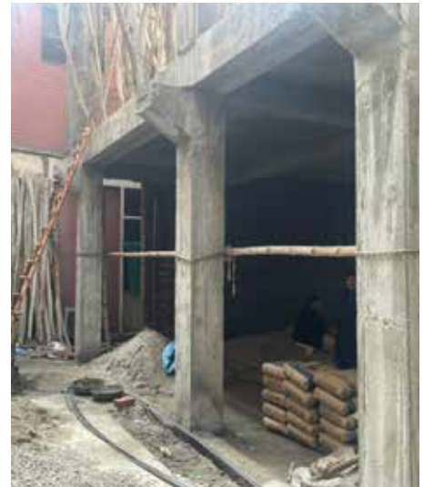
Under Construction Gynecology Operation Theater Complex

گائناکولوجی آپریشن تھیٹر کمپلیکس کی تعمیر و مرمت