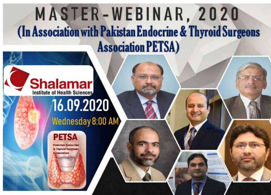
The speakers at the Shalamar Endocrine Master-Webinar 2020 held at the 5th International Conference