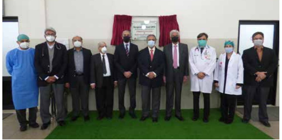
The attendees of the Inauguration Ceremony pose for a group photo with the chief guests

میڈیکل اینڈ سرجیکل اوپی ڈی کی افتتاحی تقریب