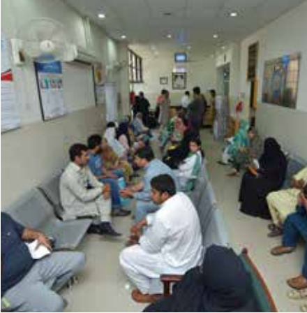
Sakina Begum Institute of Diabetes & Endocrine Research (SIDER), Shalamar Hospital سکینہ بیگم انسٹیٹیوٹ آف ذیابیطس اینڈ وکرائن ریسرچ

November 14: To raise awareness about diabetes and its prevention, Sakina Begum Institute of Diabetes & Endocrine Research (SIDER) in collaboration with the Business Planning & Development Department at Shalamar Institute of Health Sciences celebrated the