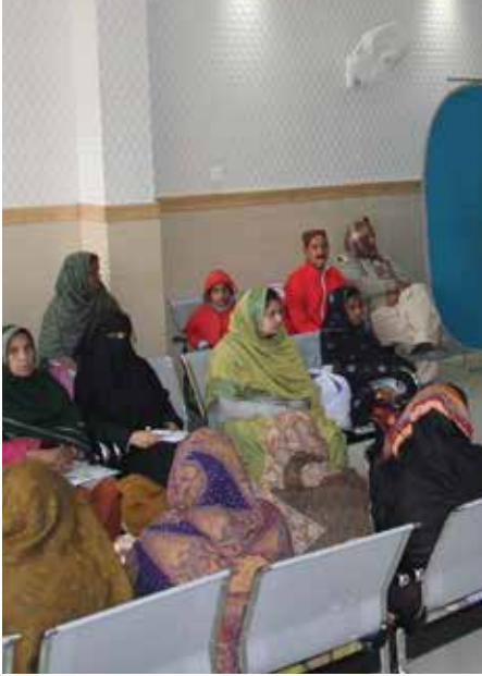
شعبہ بہبود مریضوں