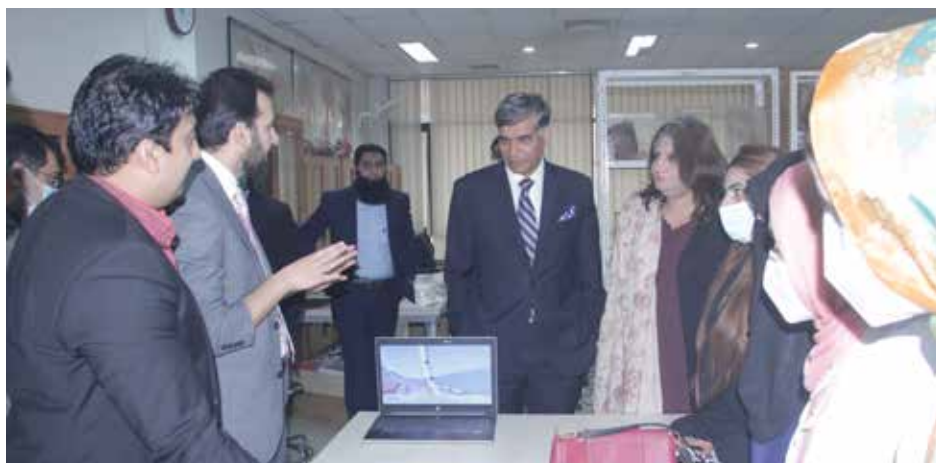
International Conference spanned over 3 days and attended by 5000 participants

Shalamar Medical College will be conducting its 7th International Conference "Sharing Solutions" from 2nd to 4th February, 2023.