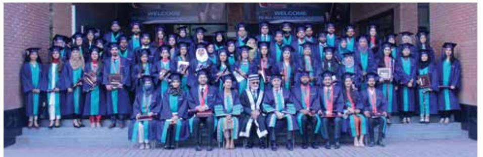
Graduates of the 1st Convocation of Shalamar School of Allied Health Sciences posing for a group photo