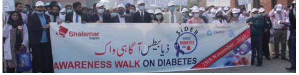
Awareness Walk being conducted on World Diabetes Day

November 15: To raise awareness about diabetes and its prevention, Sakina Begum Institute of Diabetes and Endocrine Research (SIDER) in collaboration with Business Planning & Development Department organized an awareness walk, seminar and free medical camp for the patients. Patients were offered free medical check-up, facility of blood sugar test along with free medicines.