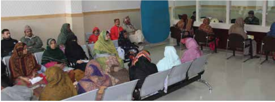
شعبہ بہبود مریضوں

In order to fulfill the vision of pioneer trustees and to achieve the objectives of the Businessmen Trust, Shalamar Hospital has been providing free/subsidized care to hundreds of thousands of needy and indigent patients over the past 40 years. The decision of the Trustees to serve the needy patients of North Eastern Lahore was met by providing direct cost subsidy on patients' billing as well as through indirect subsidy incurred by charging the medical services provided to deserving patients below the actual cost. During July 2021-February 2022 alone over 284,178 patients