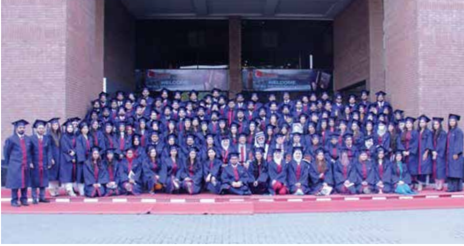
Graduates of the 7th Convocation of Shalamar Medical &amp; Dental College posing for a group photo

شالامار میڈیکل اینڈ ڈینٹل کالج کے ساتویں کانوکیشن کے گریجویٹس کی گروپ فوٹو۔