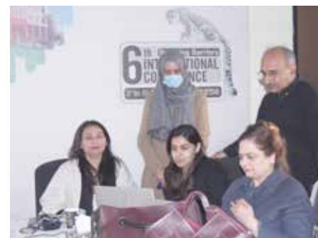
Conference had 24 Parallel Scientific Sessions